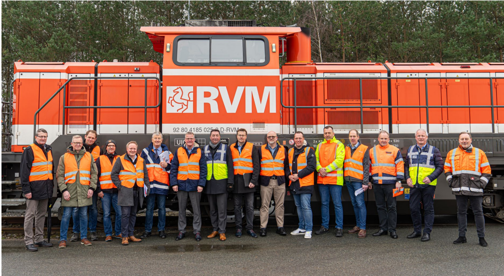
Gruppenfoto auf der KLV-Anlage