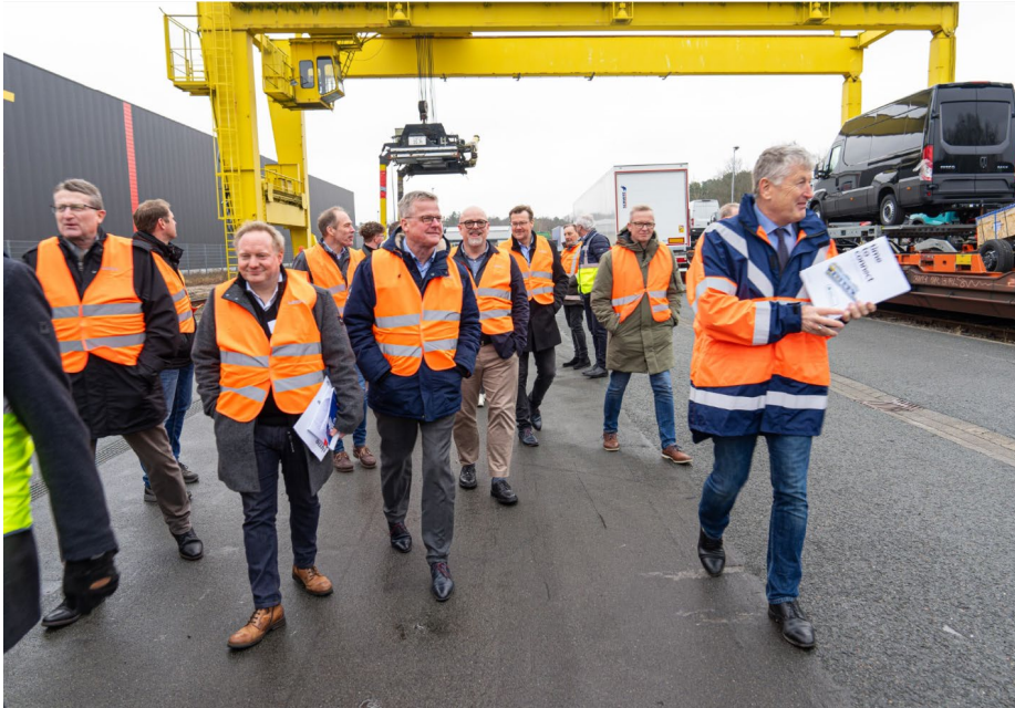
Begehung der KLV-Anlage