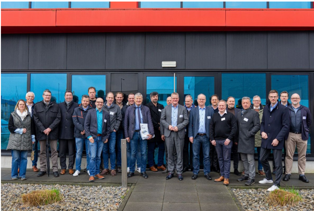
Gruppenfoto bei der Fa. Wanning