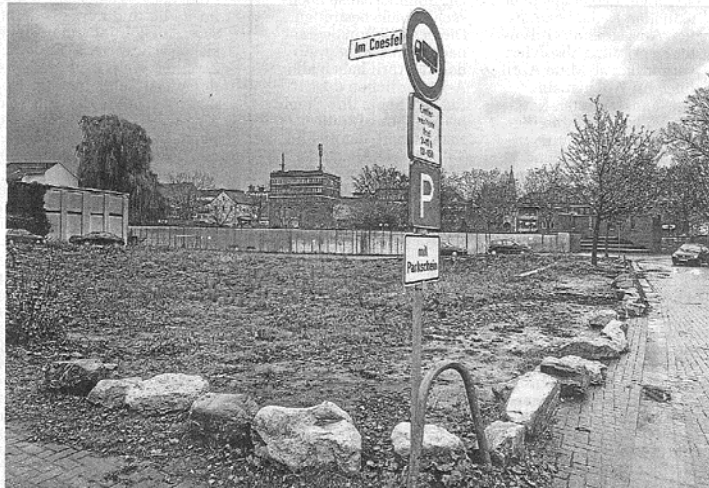
Im Laufe des Jahres will Klaas ein Kernareal im Bezirk „Im Coesfeld“ arrondiert haben.

Klaas: Die Gespräche über die Grundstücksarrondierung verlaufen in einer angenehmen Atmosphäre. Die meisten Grundstückseigentümer möchten ihre Grundstücke verkaufen und auch einer Entwicklung des Quartiers nicht im Wege stehen. Die